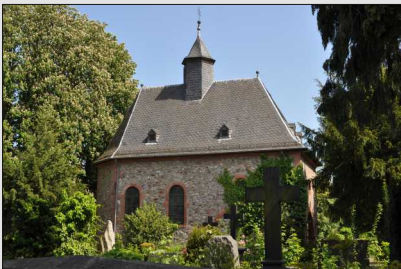
Kreuzkapelle im Alten Friedhof Geschwister-Scholl-Platz