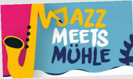
Jazz meets Mühle