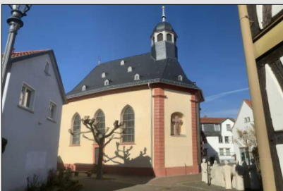
Hospitalkirche Strackgasse 8