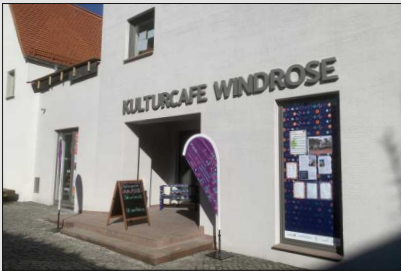
Kulturcafé Windrose Strackgasse 6