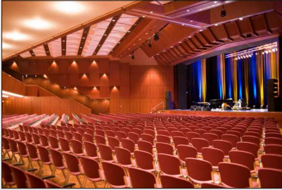
Stadthalle Rathausplatz 2