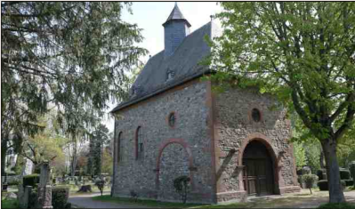
Kreuzkapelle im Alten Friedhof Geschwister-Scholl-Platz