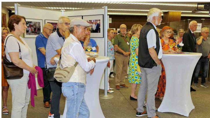
Herbst-Ausstellung Photo-Cirkel