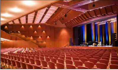
Stadthalle Rathausplatz 2