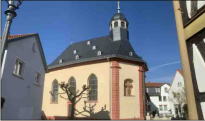
Hospitalkirche Strackgasse 8