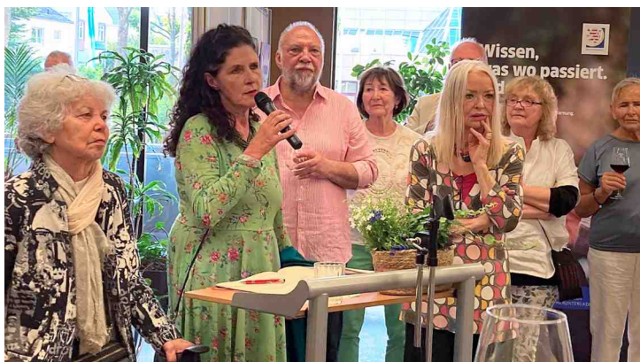
Jahresausstellung PrismO