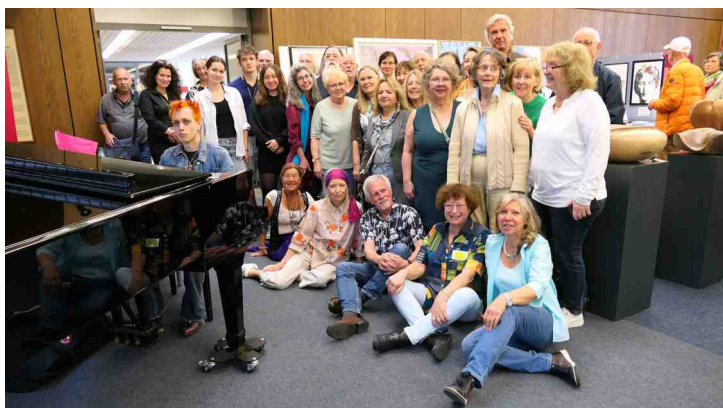
Kunst findet Stadt