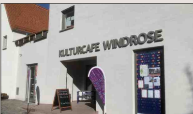
Kulturcafé Windrose Strackgasse 6