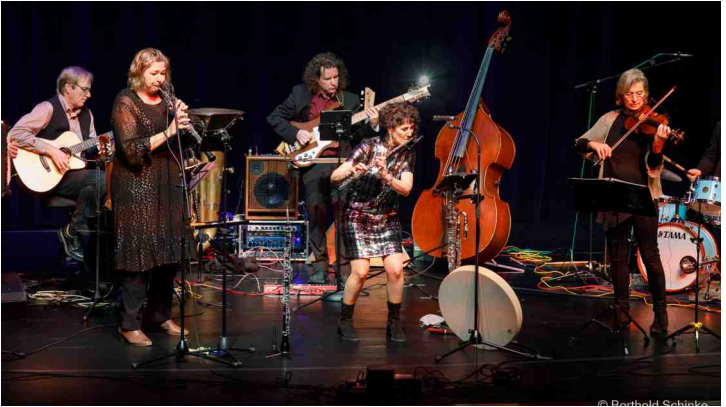
La Serena Ensemble