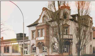
Portstraße – Jugend & Kultur Hohemarkstraße 18