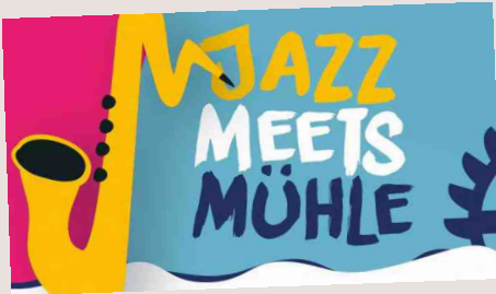
Jazz meets Mühle