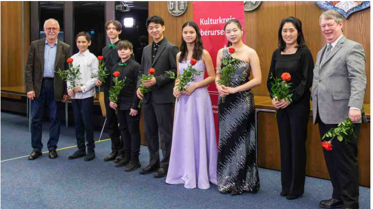
Podium Junger Talente